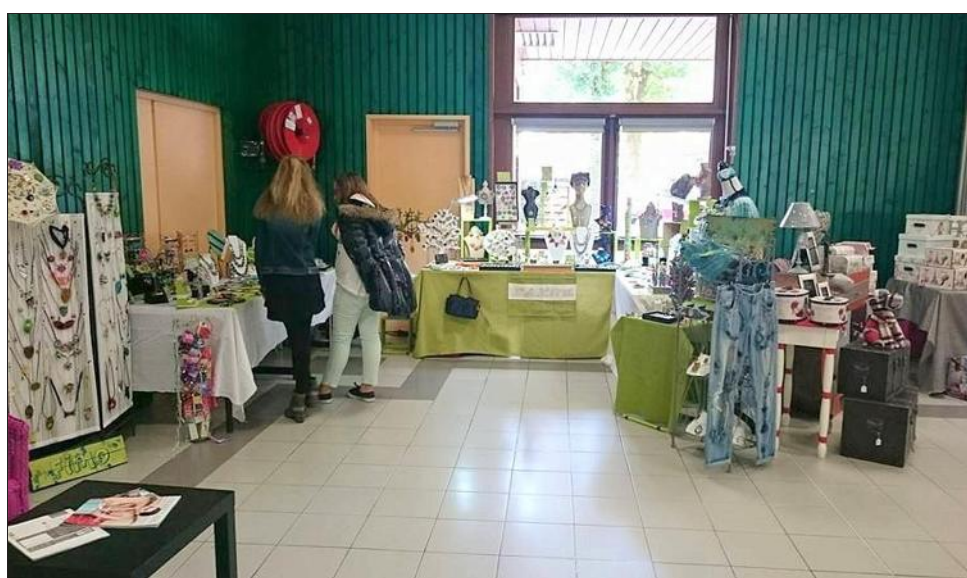
Le service culturel de la mairie organise le premier Marché des créateurs samedi 7 et dimanche 8 novembre de 10h à 18h à la salle des fêtes de Gex.

Fédérant artistes, créateurs et artisans d'art gessiens, le week-end réunira treize membres de l'association Suzanne Art' de Segny, enrichie de quatre autres créateurs indépendants gexoïis et gessiens. Ils proposeront essentiellement des loisirs créatifs. Le public pourra rencontrer les artistes, découvrir des objets artisanaux originaux, des pièces uniques et des créations réalisées en séries limitées. Mais aussi assister à des démonstrations et peut-être acheter des cadeaux originaux.